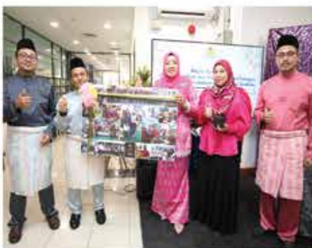
8 MAC 2024 MAJLIS SAMBUTAN IHYA RAMADHAN DAN PERSARAAN KAKITANGAN PPANS DI PERPUSTAKAAN NEGERI, SEREMBAN