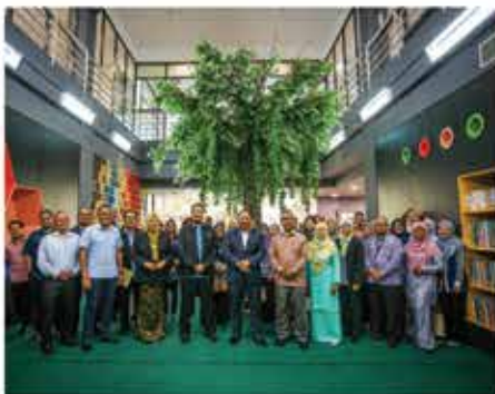
5 FEBRUARI 2024 PROGRAM BUAL BICARA SECARA LANGSUNG BUKU DI HATI BERSAMA YB DATO' MOHD ZAFIR BIN IBRAHIM, SETIAUSAHA KERAJAAN NEGERI SEMBILAN DI PERPUSTAKAAN NEGERI, SEREMBAN 2