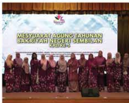
22 MAC 2024 MESYUARAT AGUNG TAHUNAN BAKRIYAH NEGERI SEMBILAN KALI KE-5