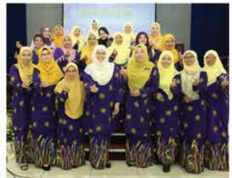
7 MAC 2024 MESYUARAT ACUNG PUSANITA YANG KE-41 DI DEWAN MAJLIS BANDARAYA SEREMBAN (MBS), SEREMBAN