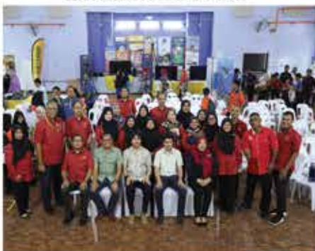
16 JANUARI 2024 PROGRAM EVOLUSI PERPUSTAKAAN SEMPERNA HARI KEPUTERAAN KE-76 DYMM YANG DI-PERTUAN BESAR NEGERI SEMBILAN DARUL KHUSUS ANJURAN PERPUSTAKAAN AWAM NEGERI SEMBILAN DI DEWAN TUANKU AMPUAN NAJIHAH SERI MENANTI, KUALA PILAH