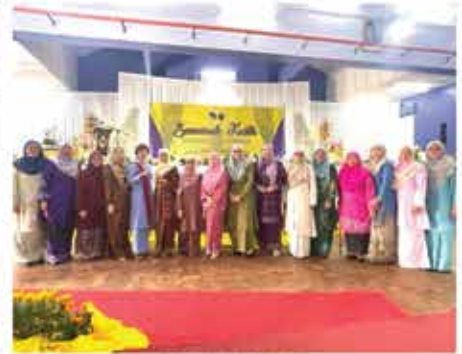
15 JANUARI 2024 SEMARAK KASIH BERSAMA DYMM TUNKU AMPUAN BESAR NEGERI SEMBILAN DARUL KHUSUS TUANKU AISHAH ROHANI BINTI ALMARHUM TENGGU BESAR MAHMUD SEMPERNA HARI KEPUTERAAN KE-76 DYMM YANG DI-PERTUAN BESAR NEGERI SEMBILAN DARUL KHUSUS DI DEWAN TUANKU AMPUAN NAJIHAH SERI MENANTI, KUALA PILAH