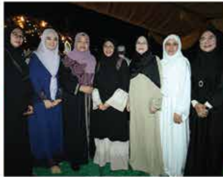
11 JANUARI 2024 MAJLIS NEGERI SEMBILAN BERSELAWAT SEMPERNA HARI KEPUTERAAN KE-76 DYMM YANG DI-PERTUAN BESAR NEGERI SEMBILAN DARUL KHUSUS DI PADANG AWAM SERI MENANTI KUALA PILAH