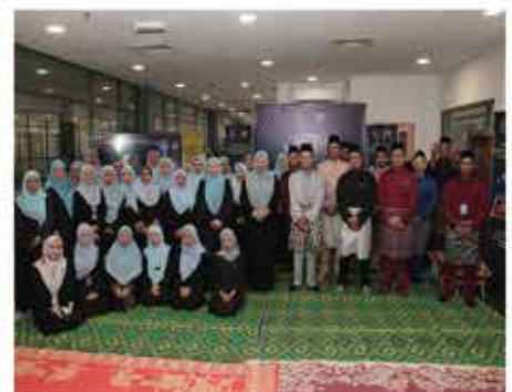
4 APRIL 2024 PROGRAM #WORLD QURAN HOUR DI PERPUSTAKAAN NEGERI, SEREMBAN 2