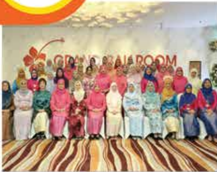
5 JANUARI 2024 MAJLIS SEPETANG BERSAMA DATO' SERI WAN AZIZAH WAN ISMAIL ANJURAN BADAN KEBAJIKAN ISTERI WAKIL-WAKIL RAKYAT DAN PEGAWAJ KANAN KERAJAAN NEGERI SEMBILAN, WAKIL RAKYAT DAN KETUA JABATAN WANITA KERAJAAN NEGERI SEMBILAN (BAKRİYAH NS) DI GRAND BALLROOM, LEXIS HIBISCUS PORT DICKSON