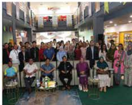
26 FEBRUARI 2024 MAJLIS PELANCARAN BUKU BERTAJUK "BAWAKU MENGEMBARA" ANJURAN INSTITUT PENDIDIKAN GURU MALAYSIA KAMPUS RAJA MELEWAR (IPGKRM) DI PERPUSTAKAAN NEGERI, SEREMBAN 2