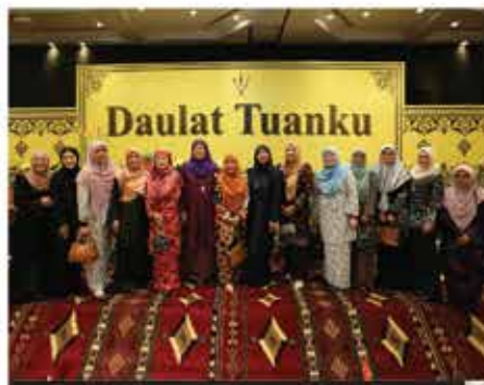
19 JANUARI 2024 MAJLIS SANTAPAN NEGERI SEMPERNA HARI KEPUTERAAN KE-76 DYMM YANG DI-PERTUAN BESAR NEGERI SEMBILAN DARUL KHUSUS DI KLANA RESORT, SEREMBAN