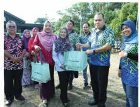
1 FEBRUARI 2024 PROGRAM TANGGUNGJAWAB SOSIAL KORPORAT (CSR) NIOSH MALAYSIA DI PUSAT AKTIVITI WARGA EMAS (PAWE), PORT DICKSON