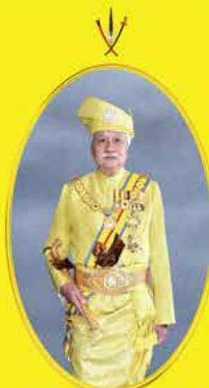
DULI YANG MAHA MULIA YANG DI-PERTUAN BESAR NEGERI SEMBILAN DARUL KHUSUS TUANKU MUHRIZ IBNI ALMARHUM TUANKU MUNAWIR D.K., D.S.M., D.K. PERANG, D.K. PERUB, D.K. BELANGOR, D.K. KESAH, D.K. MELANTAN, D.K. LAGORI, D.K. TERENGGANGU, D.K. PAU, M.L.

PERBADANAN PERPUSTAKAAN AWAM NEGERI SEMBILAN