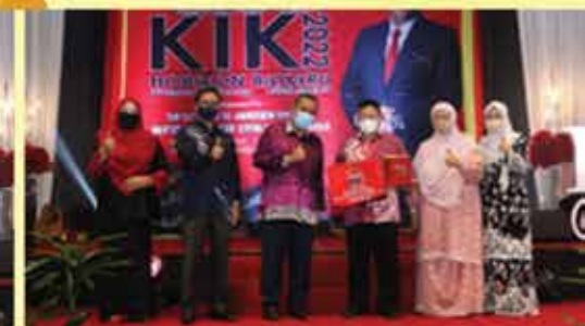
KETIGA PERBADANAN PERPUSTAKAAN AWAM TERENGGANU ( R.E.A.D )