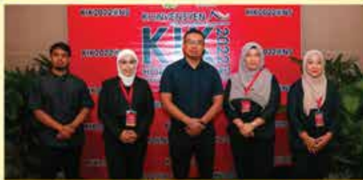
PUSTAKA NEGERI SARAWAK KUMPULAN NADIM