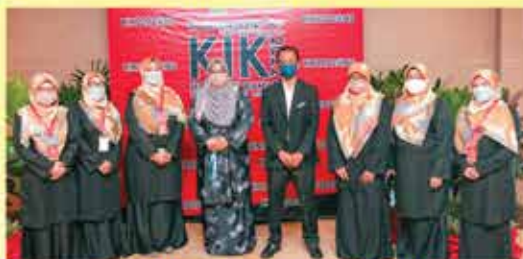
PERBADANAN PERPUSTAKAAN AWAM PULAU PINANG KUMPULAN CAPTIVATORS