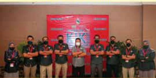
PERBADANAN PERPUSTAKAAN AWAM TERENGGANU KUMPULAN R.E.A.D