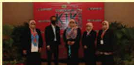
PERBADANAN PERPUSTAKAAN AWAM PULAU PINANG KUMPULAN BIBLIOTECA