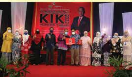
JOHAN PERBADANAN PERPUSTAKAAN AWAM SELANGOR ( EASY.GO )