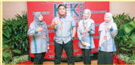
PERBADANAN PERPUSTAKAAN AWAM NEGERI PERAK KUMPULAN XTREAM