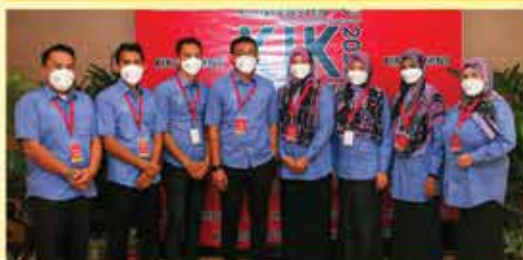
PERBADANAN PERPUSTAKAAN AWAM KEDAH KUMPULAN I-LIBS