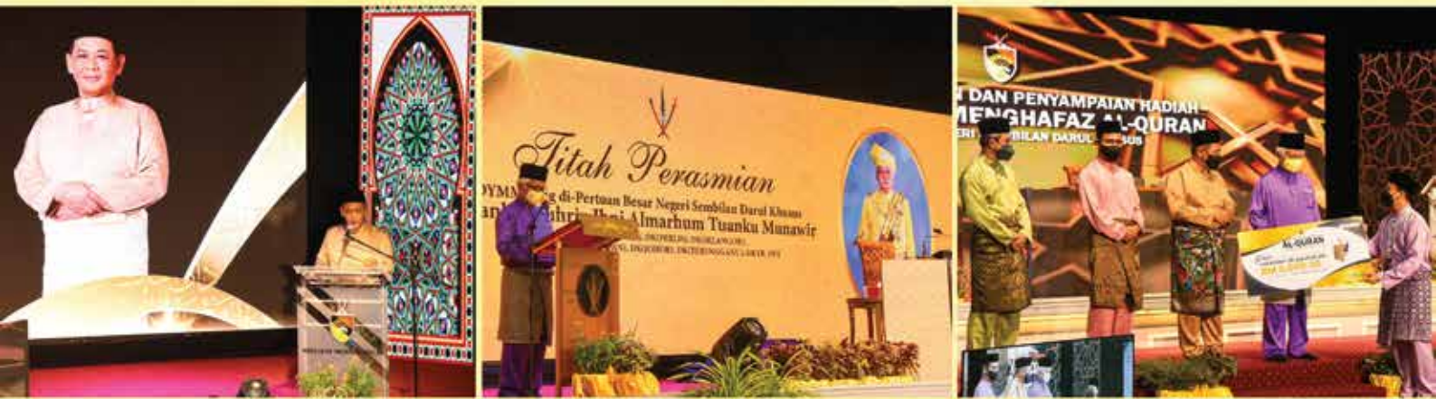
MENCEMAR DULI KE MAJLIS PENUTUPAN DAN PENYAMPAIAN HADIAH TILAWAH DAN MENGHAFAZ AL-QURAN PERINGKAT NEGERI SEMBILAN BAGI TAHUN 1443 HIJRAH BERSAMAAN 2022 MASIHI DI PUSAT DAKWAH ISLAM PAROI, SEREMBAN