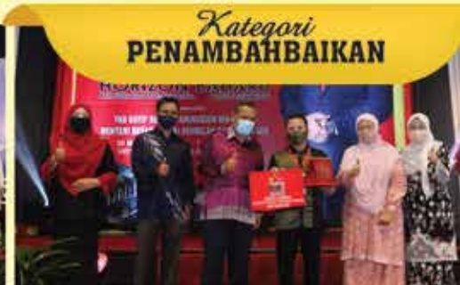
Kategori PENAMBAHBAIKAN NAIB JOHAN PERPUSTAKAAN NEGERI SABAH CAWANGAN RANAU( LIBRU )