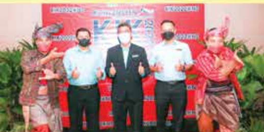
PERBADANAN PERPUSTAKAAN AWAM MELAKA KUMPULAN PERPUSTAM CREW