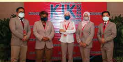
PUSTAKA NEGERI SARAWAK CAWANAGN MIRI KUMPULAN PRODIGY 6