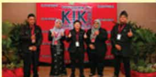
PERPUSTAKAAN TUN ABDUL RAZAK UNIVERSITI TEKNOLOGI MARA, SHAH ALAM KUMPULAN I-CLIQUE