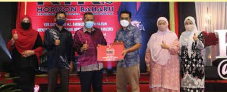
ANUGERAH PERSEMBAHAN TERBAIK EASY.GO (SELANGOR)