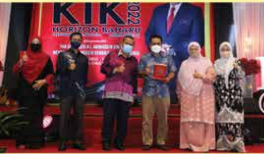
ANUGERAH KUMPULAN TERBAIK EASY.GO ( SELANGOR )