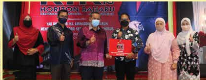
ANUGERAH POSTER BUNTING TERBAIK MIZAN (UKM BANGI)