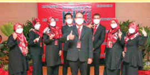
PERPUSTAKAAN UNDANG-UNDANG UKM, BANGI KUMPULAN MIZAN