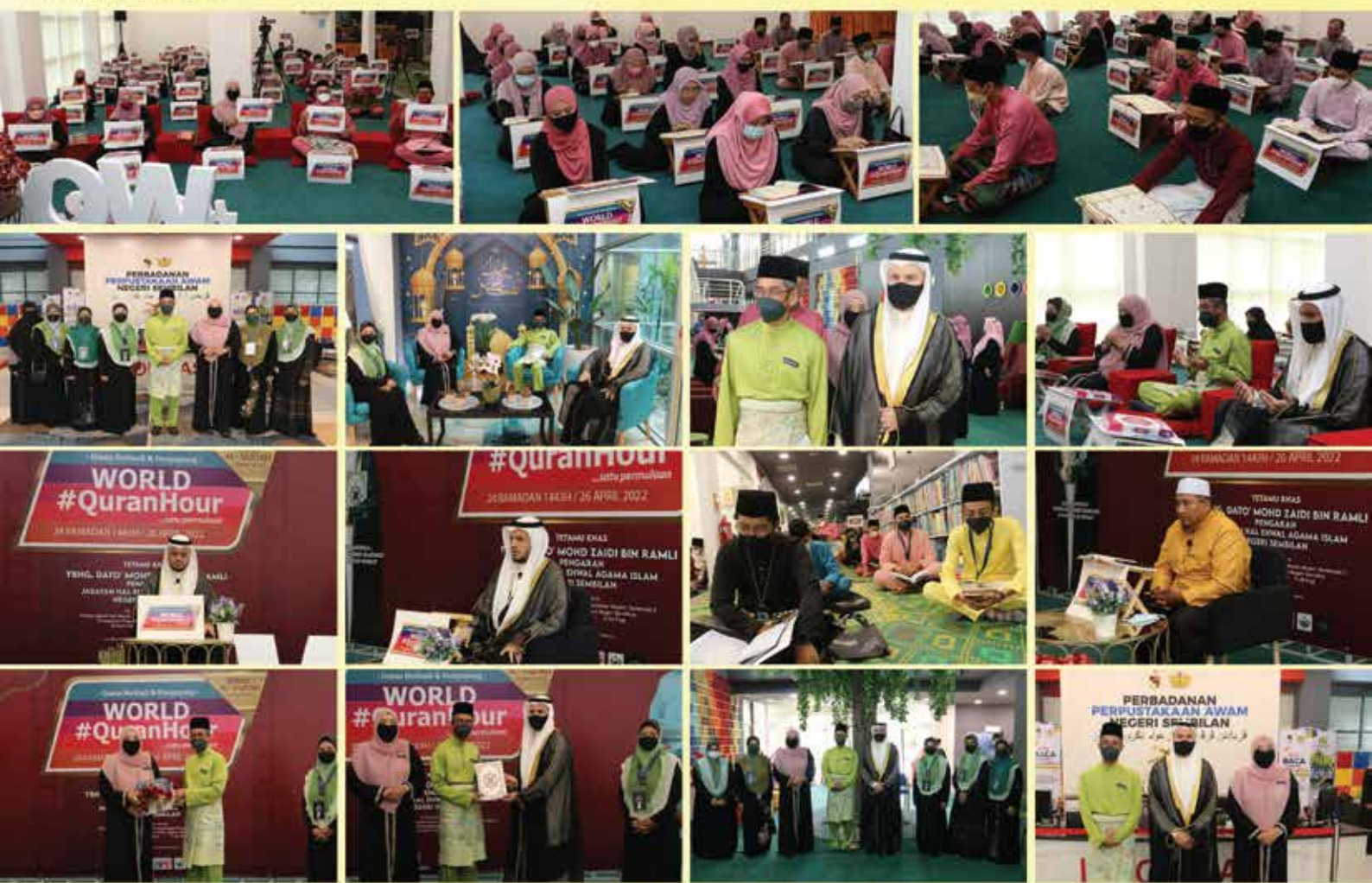
PERBADANAN PERPUSTAKAAN AWAM NEGERI SEMBILAN (PPANS)

yang bermaksud Sujud pula akan menjadi surah utama di dalam misi #QuranHour tahun ini bagi mengajak orang ramai menghayati erti Sujud yang sebenarnya. Seorang hamba yang bersujud kepada tuhan nya dengan penuh keyakinan kepada Allah pasti dapat membuang sifat ego atau sombong yang menjadi formula untuk Berjaya di dunia & akhirat.