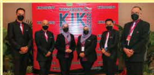
PERBADANAN PERPUSTAKAAN AWAM NEGERI SEMBILAN KUMPULAN TOSHOKAN