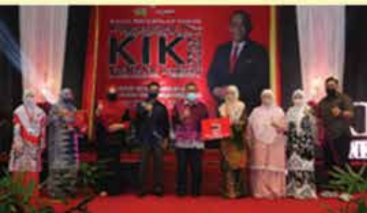
JOHAN PERBADANAN PERPUSTAKAAN AWAM PERAK ( XTREAM )