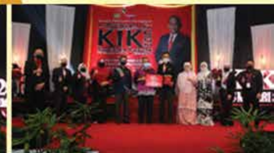
KETIGA PERBADANAN PERPUSTAKAAN AWAM NEGERI SEMBILAN ( TOSHOKAN )