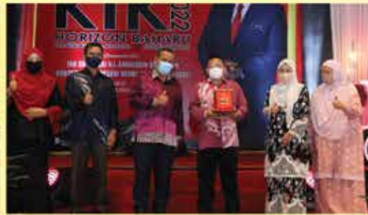
ANUGERAH DOKUMENTASI TERBAIK R.E.A.D (TERENGGANU)