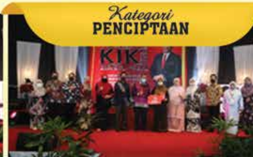
Kategori PENCIPTAAN NAIB JOHAN PERPUSTAKAAN UNDANG-UNDANG, UNIVERSITI KEBANGSAAN MALAYSIA, BANGI ( MIZAN )