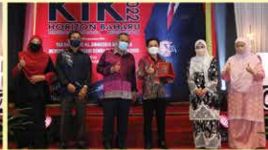
ANUGERAH PRODUK INOVASI DAN KREATIF TERBAIK PRODIGY 6 (SARAWAK)