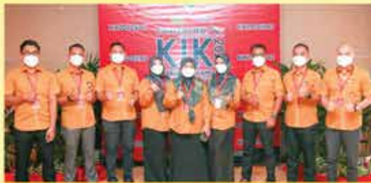
PERBADANAN PERPUSTAKAAN AWAM KEDAH KUMPULAN D' BACA