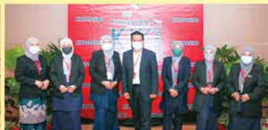
PERBADANAN PERPUSTAKAAN AWAM SELANGOR KUMPULAN EASY.GO