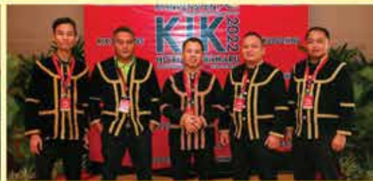
PERPUSTAKAAN NEGERI SABAH CAWANGAN RANAU KUMPULAN LIBRU