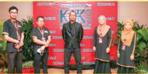
PERPUSTAKAAN NEGERI SABAH CAWANGAN BEAUFORT KUMPULAN MOGOGOT

KONVENSyen KUMPULAN INOVATIF DAN KREATIF (KIK) HORIZON BAHARU PERPUSTAKAAN AWAM SE-MALAYSIA 2022 @ NEGERI SEMBILAN ANJURAN PERBADANAN PERPUSTAKAAN AWAM NEGERI SEMBILAN DENGAN KERJASAMA MAJLIS PENGARAH-PENGARAH PERPUSTAKAAN AWAM SE-MALAYSIA (MPAM).