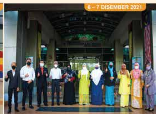
LAWATAN PENANDA ARAS PERPUSTAKAAN AWAM PULAU PINANG KE PERPUSTAKAAN NEGERI, SEREMBAN 2