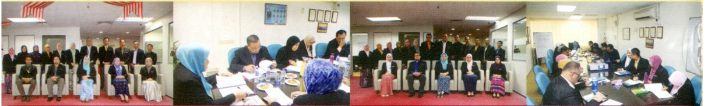
MESYUARAT PENGURUSAN PPANS DI BILIK MESYUARAT 2, TINGKAT MEZZANINE, PPANS PADA 11 OKTOBER & 6 DISEMBER 2018