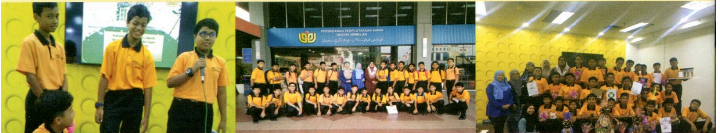
PROGRAM SAYANGI BUMI KITA YANG DISERTAI OLEH PELAJAR SEKOLAH DATO' ABDUL RAZAK, SEREMBAN PADA 1 NOVEMBER 2018