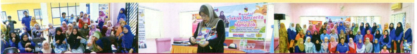
BENKEL TEKNIK BERCERITA BERSAMA MAMA TOK DI PERPUSTAKAAN AWAM CAWANGAN REMBAU PADA 12 DISEMBER 2018