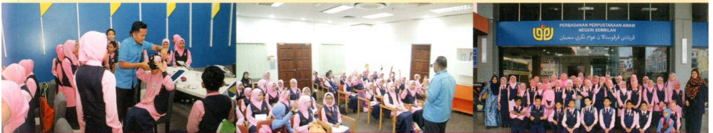
LAWATAN SAMBIL BELAJAR KE PPANS OLEH SEKOLAH KEBANGSAAN SEREMBAN 2A PADA 17 OKTOBER 2018