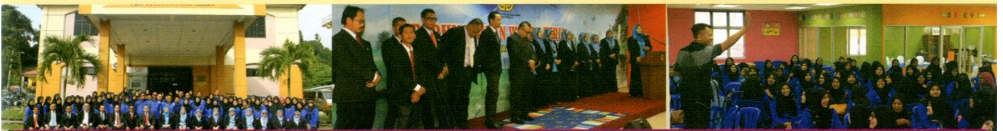
PERHIMPUNAN BULANAN WARGA KERJA PPANS BIL 2/2018 DI PERPUSTAKAAN AWAM CAWANGAN JELEBU PADA 10 DISEMBER 2018