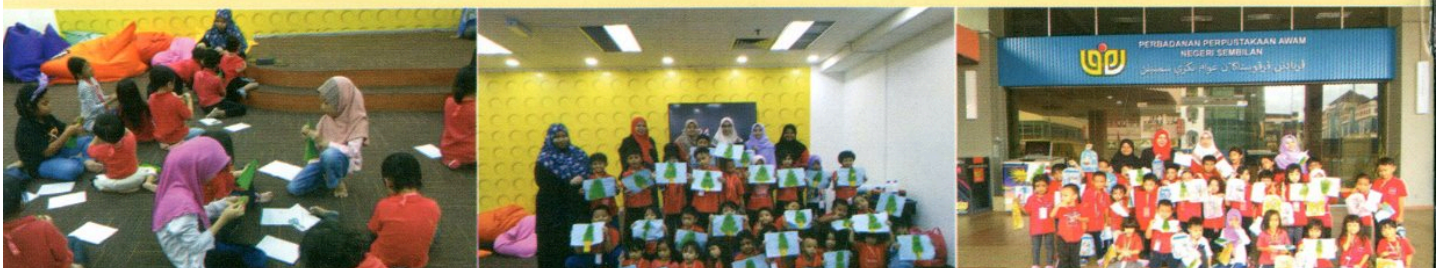
LAWATAN SAMBIL BELAJAR OLEH TADIKA ANDRA, NILAI PADA 13 DISEMBER 2018