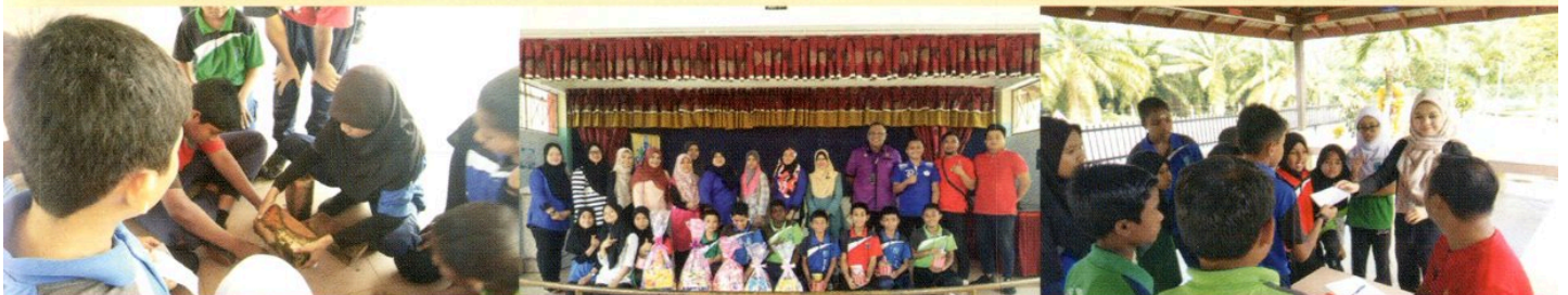
PROGRAM JEJAK MAKLUMAT DI SK DATO' RAJA MELANA PADA 9 OKTOBER 2018