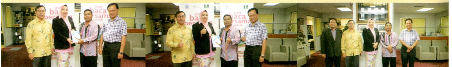
PENYERAHAN BUKU DARI SEMINAR PENYELIDIKAN PADA 15 NOVEMBER 2018