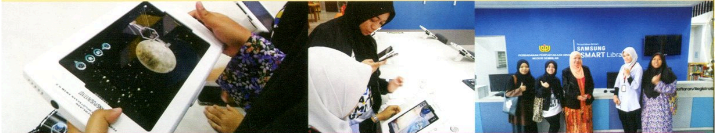
KAJIAN KURSUS ENVIRONMENT AND PUBLIC ADMINISTRATION OLEH PELAJAR UITM SEREMBAN 3 PADA 18 OKTOBER 2018