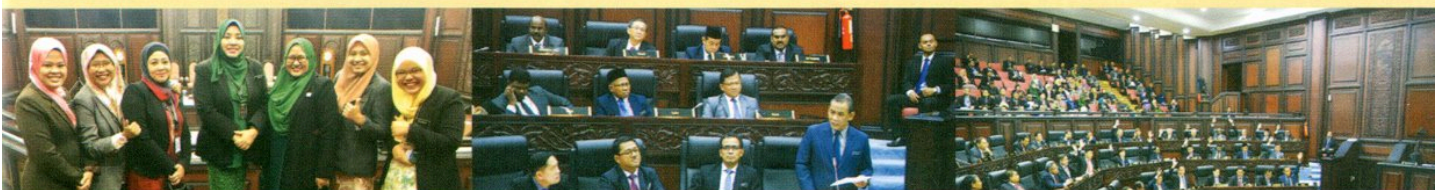
PERSIDANGAN KETIGA (BELANJAWAN) PENGGAL PERTAMA, DEWAN UNDANGAN NEGERI, NEGERI SEMBILAN YANG KE-14 DI GALERI PERSIDANGAN, DEWAN UNDANGAN NEGERI PADA 17-19 DISEMBER 2018. TURUT HADIR, PENGARAH PERBADANAN PERPUSTAKAAN AWAM NEGERI SEMBILAN.