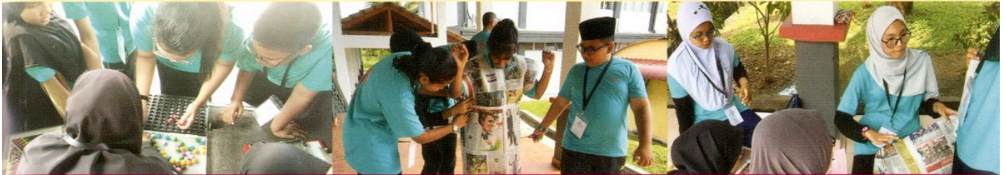
PROGRAM JEJAK MAKLUMAT DI BAHAGIAN TEKNOLOGI PENDIDIKAN NEGERI, NEGERI SEMBILAN SEMPENA TOKOH NILAM NEGERI SEMBILAN PADA 9 OKTOBER 2018