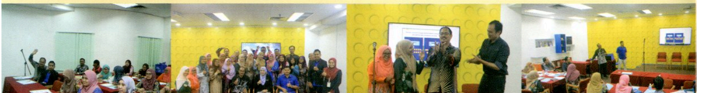
BENGGEL PENGACARAAN MAJLIS RASMI DAN PROTOKOL KEPADA KAKITANGAN PPANS OLEH PENCERAMAH DARI JABATAN PENERANGAN NEGERI, NEGERI SEMBILAN DIADAKAN DI BILIK AKTIVITI, PPANS PADA 1 NOVEMBER 2018