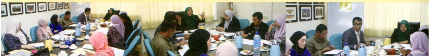
MESYUARAT KOORDINASI PROJEK BERSAMA JABATAN KERJA RAYA, NEGERI SEMBILAN DI BILIK MESYUARAT 2, TINGKAT MEZZANINE, PPANS PADA 23 OKTOBER 2018