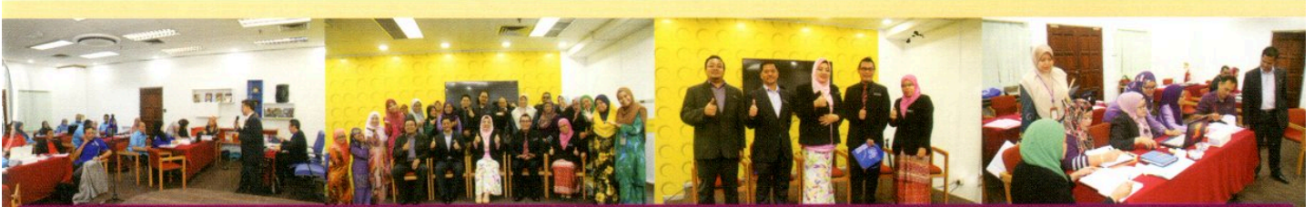
BENKEL KLASIFIKASI FAIL OLEH ARKIB NEGARA MALAYSIA, KUALA LUMPUR DI BILIK AKTIVITI, PPANS PADA 14 NOVEMBER & 15 NOVEMBER 2018