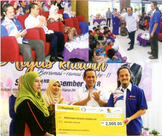
1 Disember 2018 Merasmikan Majlis Khatam beramai-ramai anjuran KPJ Seremban