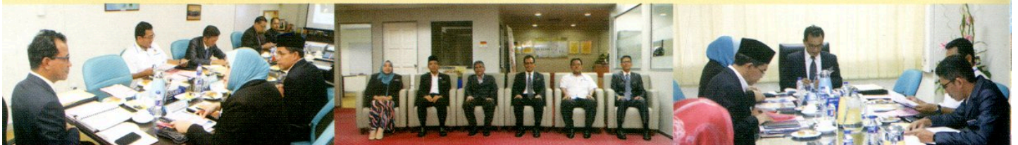
MESYUARAT AHLI LEMBAGA PENGARAH BILANGAN 2/2018 DI BILIK MESYUARAT 2, TINGKAT MEZZANINE, PPANS PADA 26 OKTOBER 2018