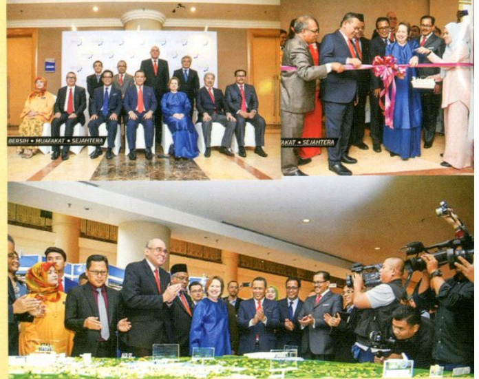
13 Disember 2018 Menghadiri Majlis Pelancaran Malaysia Vision Valley 2.0 serta Perasmian Program Publisiti dan Perancangan Awam Rancangan Tempatan MVV 2045 di Royale Chulan, Seremban