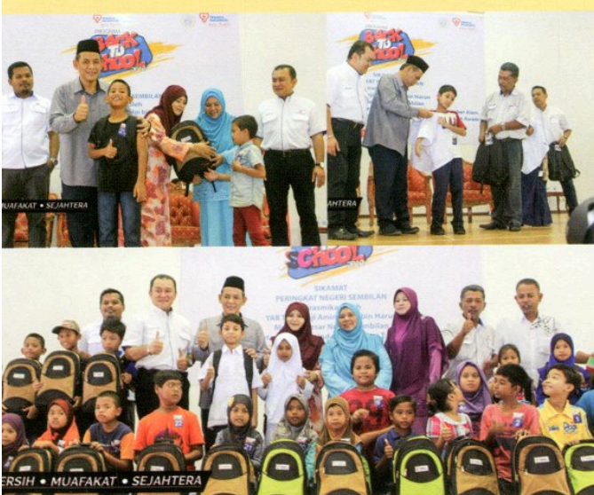
16 Disember 2018 Menyerahkan peralatan persekolahan kepada 200 kanak-kanak keluarga asnaf sekitar DUN Sikamat dalam program 'Back to School 2019' anjuran Tenaga Nasional Berhad (TNB) di Dewan Orang Ramai Sikamat.