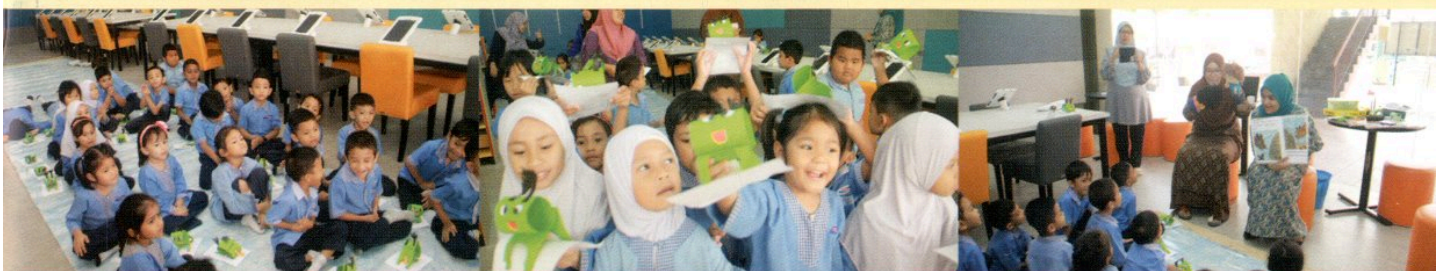
LAWATAN SAMBIL BELAJAR KE PPANS OLEH TABIKA KEMAS BANGUNAN SIKAMAT 2 PADA 17 OKTOBER 2018