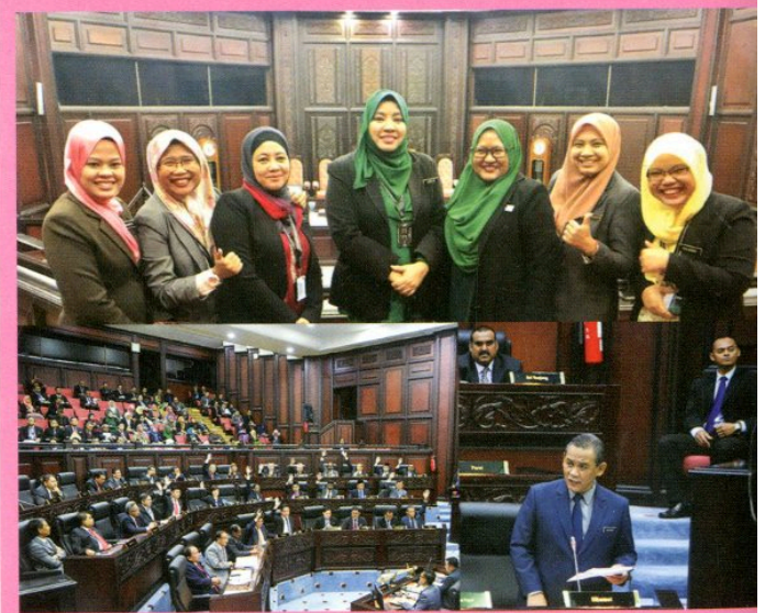
17 - 19 Disember 2018 Persidangan Ketiga (Belanjawan) Penggal Pertama, Dewan Undangan Negeri, Negeri Sembilan Yang Ke-14