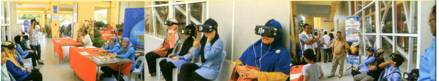
PAMERAN SAMSUNG SMART LIBRARY DI MINGGU INOVASI PERINGKAT NEGERI SEMBILAN, DI POLITEKNIK PORT DICKSON PADA 21 OKTOBER 2018