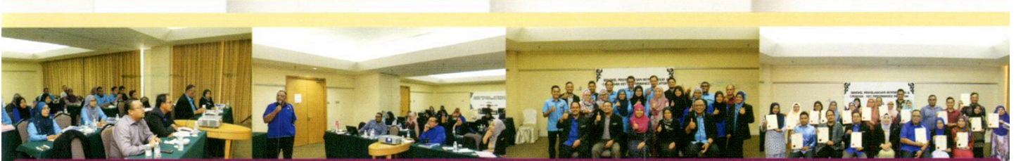
BENKEL PENYELARASAN MYPORTFOLIO DAN CADANGAN KEY PERFORMANCE INDICATOR (KPI) PPANS 2019 DI HOTEL ROYALE CHULAN, SEREMBAN, PADA 21 DAN 22 NOVEMBER 2018